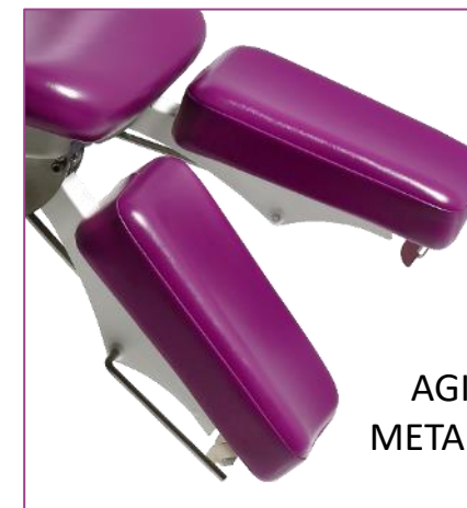
AGIRE SULLA LEVA DI METALLO PER ABBASSARE LE GAMBIERE