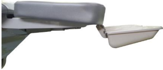
Kit 2 vaschette per gambiere

Protezione gambiere in tessuto lavabile (colore bianco)